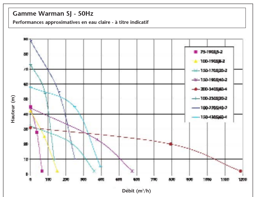
La gamme Warman de pompes submersibles d'épuisement SJ

Nos pompes d'épuisement SJ sont immergeables jusqu'à une profondeur de 20 mètres et n'ont pas de contraintes de hauteur d'aspiration, contrairement aux pompes auto-amorçantes. La pompe ne doit pas être déplacée pour suivre la variation éventuelle du niveau d'eau, et elle peut fonctionner dénoyée au cas où celui-ci descend très bas. Il n'y a donc pas besoin de tuyau d'aspiration ni de système d'amorçage.