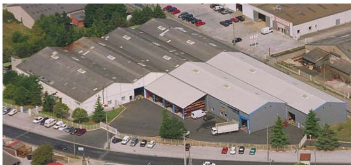
Usine de Castres (81)